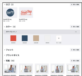
最近はツールに保存できるものも