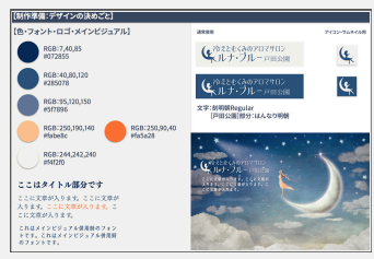
カラーコードや使用フォントについてマニュアルとしてまとめ、活用する

最近ではクラウドメモ系のアプリ（例：notion）での共有や、デザインアプリ内の「ブランド機能」の活用（例：有料版Canva）など、複数人での色やフォント、画像、ロゴ等の管理がしやすくなっています。