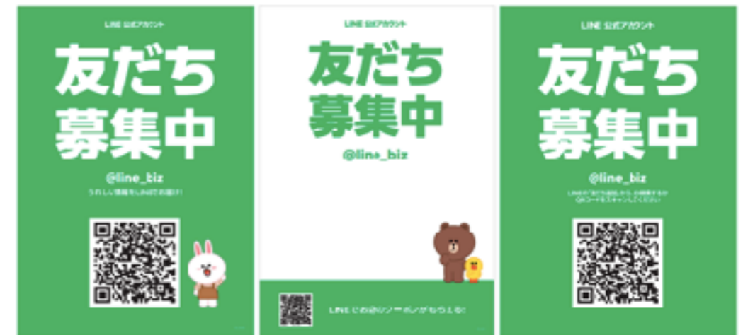
LINEが提供しているLINE公式アカウントへの友達登録をしてもらいやすくするPOPのテンプレート