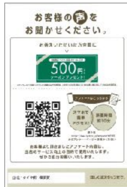
回答に10分かかるアンケートへの誘導