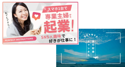
サムネイル/オープニング動画