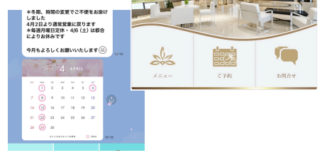
カレンダー/リッチメニュー