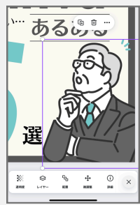
選びづらい時や微調整したい時 重ね順を変えたい時の方法