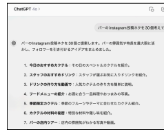
浮かばないなら AIの知恵を拝借