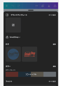
よく使うフォントや色を ブランドに仕込んでおく