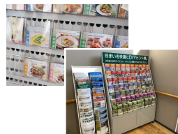
似たネタを展開して活用・ 流用 (シリーズ化) する