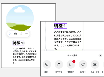
かたまりにして移動させたい時は複数選択orグループ化