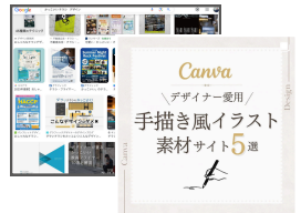
デザインの参考資料は ネットから探す