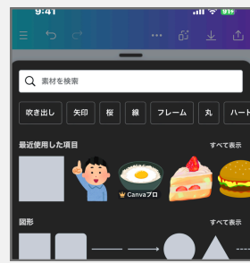
探したい素材の検索ワードを 仕込んでおく