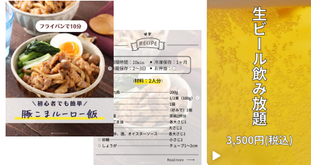
ページものの投稿/リール・ストーリー動画