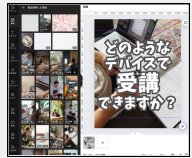
Canvaの「一括作成」機能で一気にネタ作成！