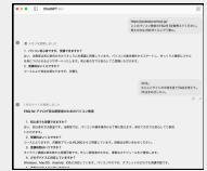
ChatGPTでよくある質問を30個ほど生成してもらう